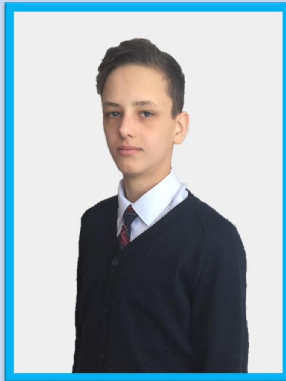
МИНИСТР ПЕЧАТИ ГАЗИЕВ РОМАН