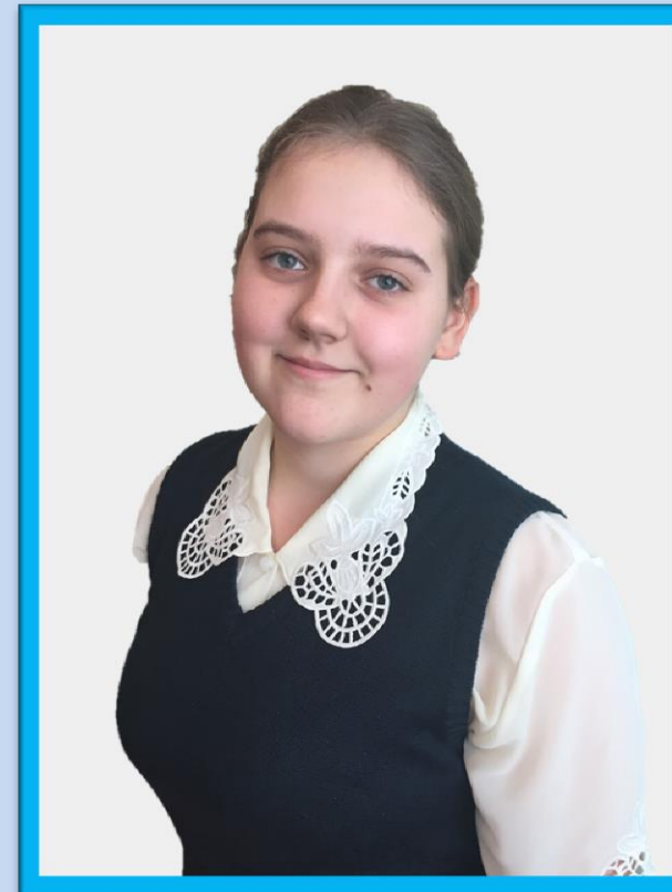
МИНИСТР КУЛЬТУРЫ ЖАРКОВА АЛЕКСАНДРА