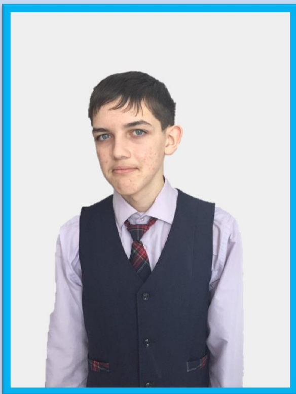
МИНИСТР ПЕЧАТИ МАРКЕЛОВ АНДРЕЙ