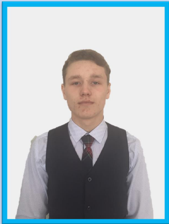
ПРЕЗИДЕНТ ГАЗИЕВ РУСЛАН